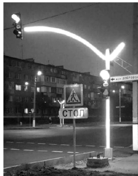
ти про те, щоб і в нього, і в сусіда було світло.

А взагалі, вимикаючи енергоємні електроприлади з 6.00 до 9.00 та з 17.00 до 23.00, кожен може подба-