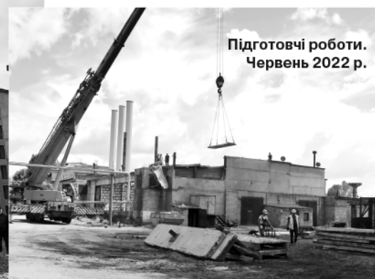
Підготовчі роботи. Червень 2022 р.

Н арешті біопаливний котел потужністю 7 МВт та допоміжне обладнання, яке чекали ще на початку 2022 року, в Горішніх Плавнях.