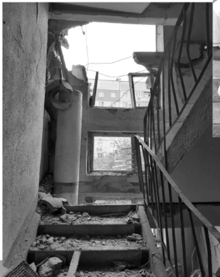
Будівля зруйнованого басейну